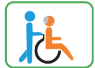
Walking or moving around